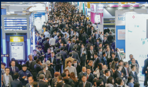
前回の会場風景(2018年)このような通路が50本(同時開催展を含む)

世界55カ国 (ドイツ、アメリカ、イタリア、中国、韓国、台湾 ...など) から 70,000名 が来場