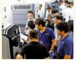
前回(2019年)の会場風景